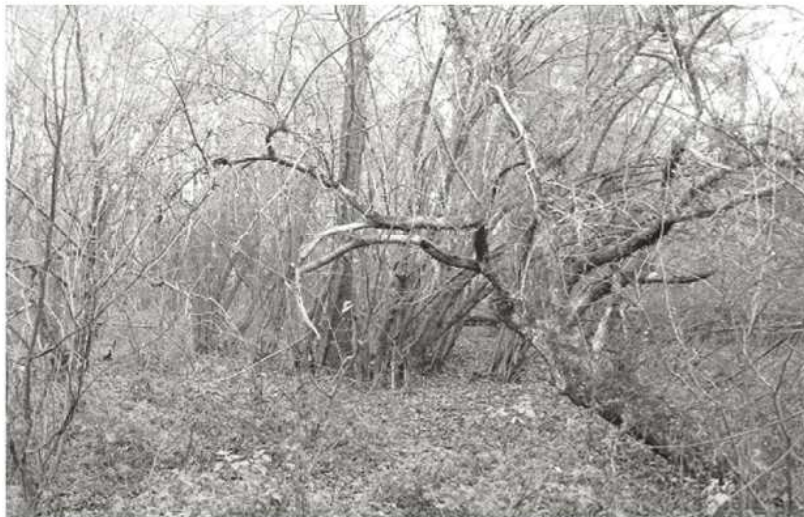
Fauna i flora, w której skład wchodzi objęte ochroną, rzadko spotykane gatunki, stanowią o wyjątkowości tego terenu.

Wieś Grochy zamieszkiwali głównie grekokatolicy, znajdowały się w niej 24 domostwa oraz jedna kuźnia. Mieszkańcy zajmowali się rolnictwem i pasterstwem, hodowali konie, bydło, jednak większość stanowiły owce. Wioska leży przy rzece Różanka biorącej początek z Wiszkiernicy. Domy były budowane z drewna, pokryte strzechą, piwnice jednak wykonywano z kamienia i wapienia. >>