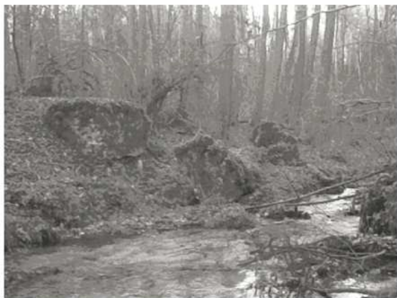
Fragment, kamiennego mostu, zniszczonego przez sowiecką partyzantkę.