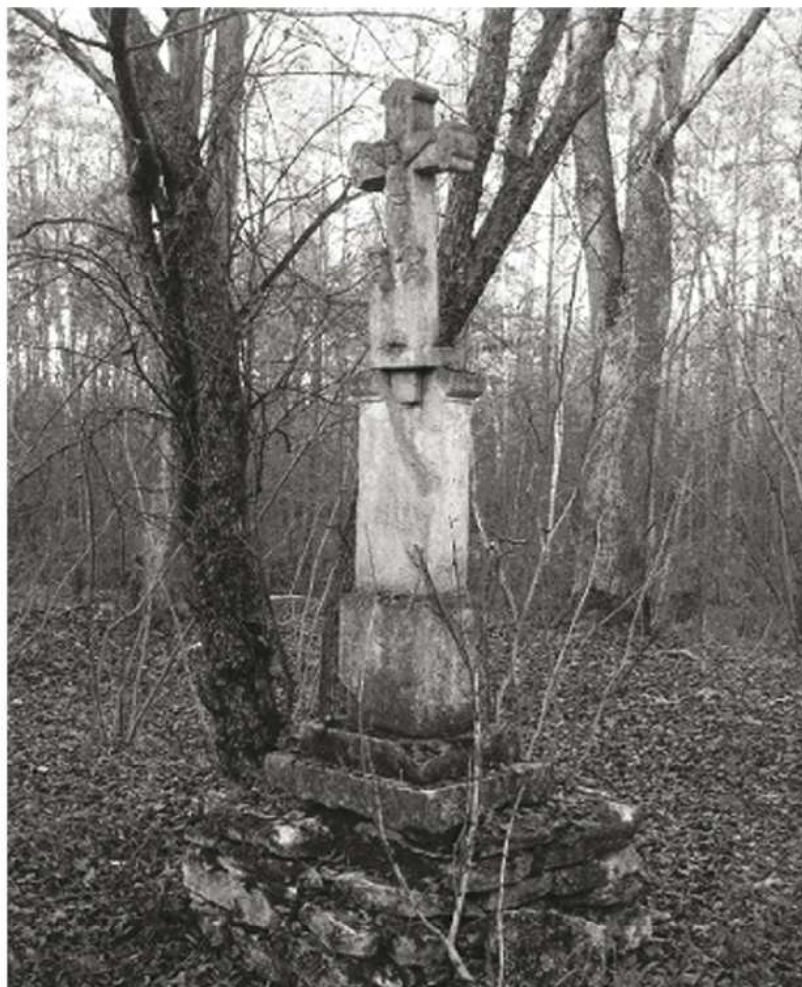
Krzyże budowano niegdyś na początkach wsi głównie po to, aby chroniły mieszkańców przed nieszczęściami.