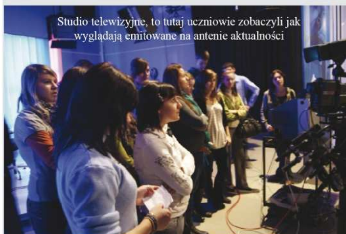
Studio telewizyjne, to tutaj uczniowie zobaczyli jak wyglądają emitowane na antenie aktualności