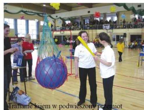
Trącanie kijem w podwieszony przemięt