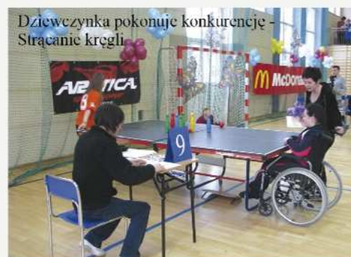
Dziewczynka pokonuje konkurencję – Strącanie kregli

sięgi Olimpiad Specjalnych: „Pragnę zwyciężyć, lecz jeśli nie będę mógł zwyciężyć, niech będę dzielny w swym wysiłku”. Należy bowiem podkreślać, że nie są to zawody w sensie rywalizacji z innymi startującymi, ale spotkanie człowieka z barierą własnych możliwości. Każdy sukces zawodnika poprzedzony jest ciężką, codzienną pracą wspólnie z rehabilitantami i trenerami. Jest to więc program zmuszający do aktywności, a jednocześnie dający radość, emocje i doping do pracy. W zawodach uczestniczyło 46 zawodników, wraz z 46 trenerami i opiekunami.