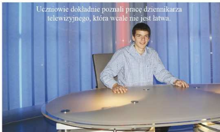
Uczniowie dokładnie poznali pracę dziennikarza telewizyjnego, która wcale nie jest łatwa.