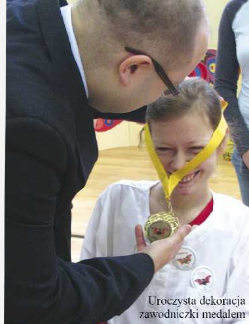
Uroczysta dekoracja zawodniczki medalem