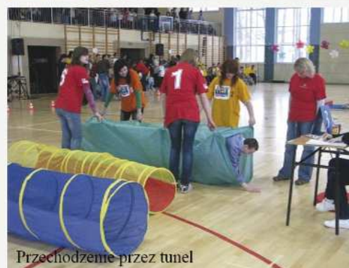
Przechodzimy przez tunel