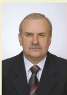
Zdzisław Cioch Przewodniczący Rady Miejskiej